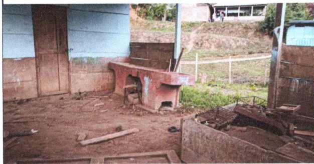
Foto 3 Cocina